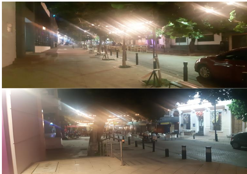
Imagen 3: Espacios regenerados en paseo del ángel

Fuente: Fotografía tomada por el autor el día 4 de septiembre de 2021.