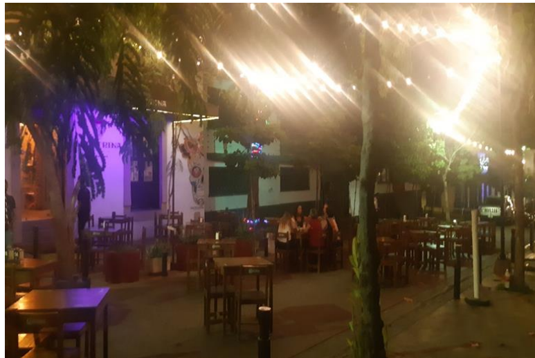
Imagen 5: Bajo aforo de un establecimiento nocturno en el Paseo del Ángel en la zona centro de Culiacán