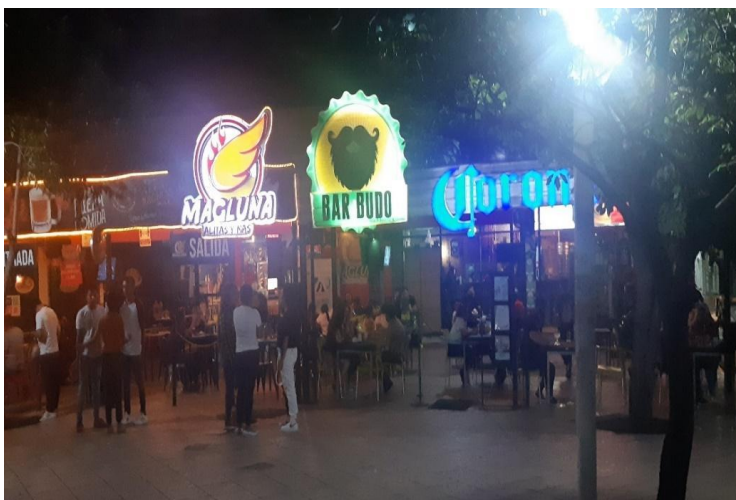
Imagen 4: Interacción nocturna en paseo del ángel de la zona centro de Culiacán