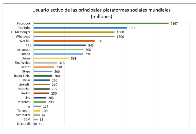
Figura 1. Usuarios activos.

Según la revista digital de investigación We are Social , la red social con mayor actividad es Facebook [22], según se muestra en la Fig. 1.