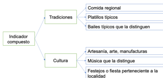
Figura 2. Estructura de los criterios considerados en el caso de estudio.